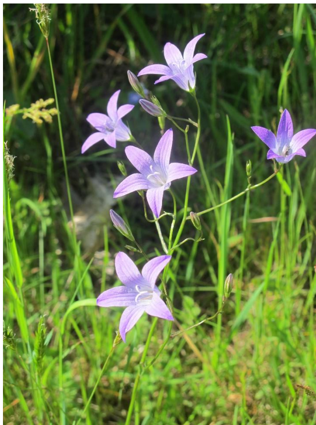
Eng-klokke ( Campanula patula ) fra 06.06.19. Hanne E.