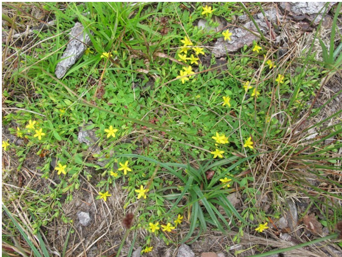
Anne Messmanns billede af dværg-perikon er taget på et andet tidspunkt.

Nikkende hullæbe ( Epipactis phyllanthes ). I ældre floraer: Glat hullæbe ( Epipactis phyllanthes ssp. confusa )