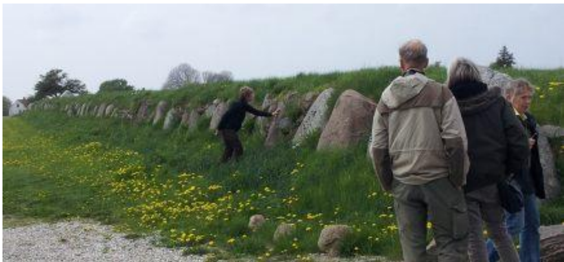
Dagens sidste stop var et besøg på Grønsalen , en langdysse med 3 gravkamre.