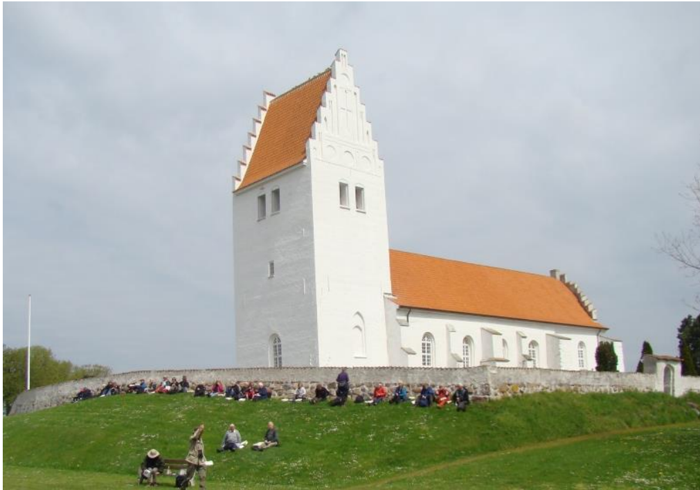
Frokost ved kirkemuren